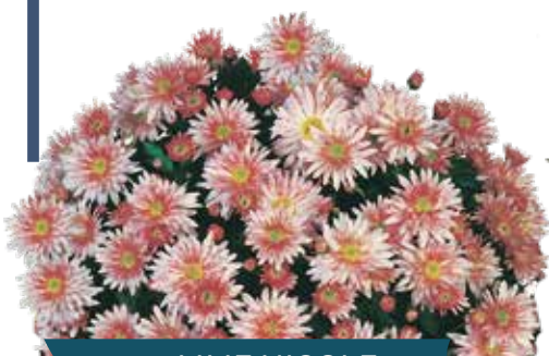
MME NICOLE FALCE ROSE ®