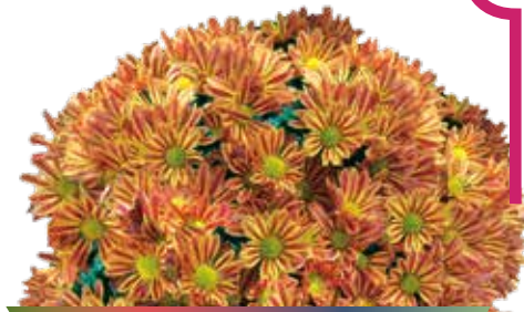
CHARLESTON ROUGE ©