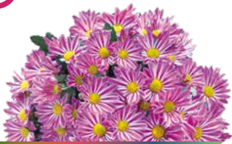
CHARLESTON ROSE ©