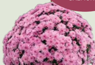
BRANFOUNTAIN PINK ©