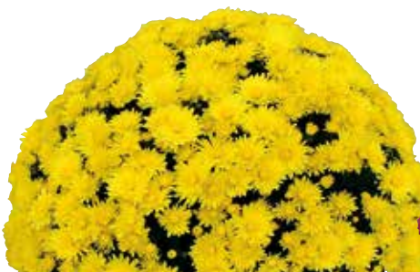
VENT DES ALPES JAUNE®