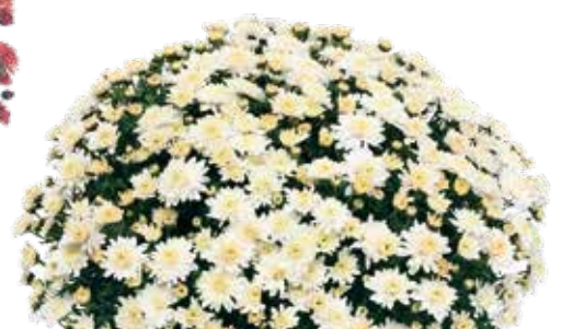
SELFIE WHITE ©