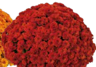
ANDALOU ROUGE ©