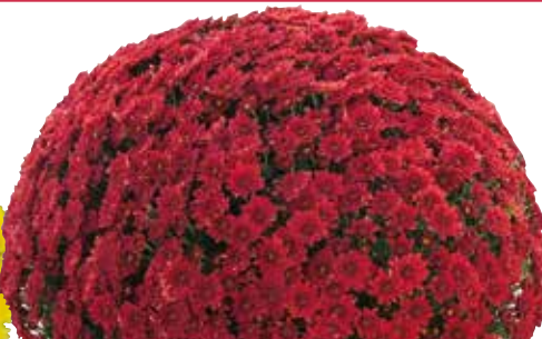
VENT DES CHINON ROUGE®