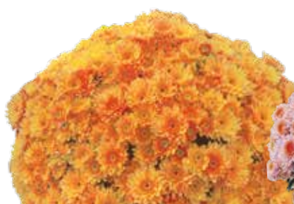
ELEPHANTINE APRICOT ©