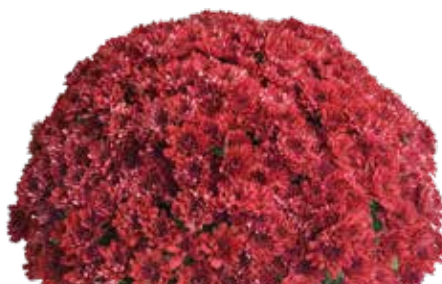
NOCTURNE ROUGE ©