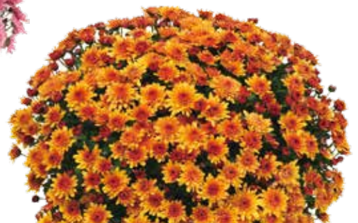
SELFIE ORANGE ©