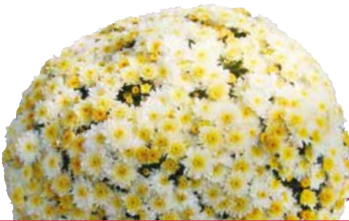
VENT DES MARQUISES CHAMPAGNE®