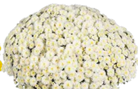
ROSANNA WHITE ©