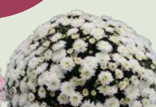
BRANFOUNTAIN WHITE ©