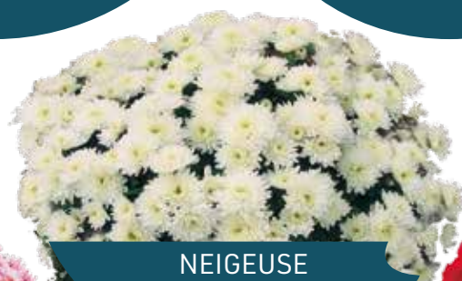
NEIGEUSE BLANC ®