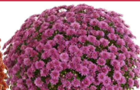
AMÉLIE PINK ©