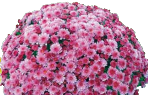
VENT DES MARQUISES ROSE®