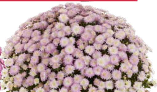
AMÉLIE LIGHT PINK ©