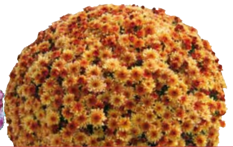
VENT DES MARQUISES DORE'®