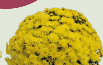
BRANFOUNTAIN YELLOW ©