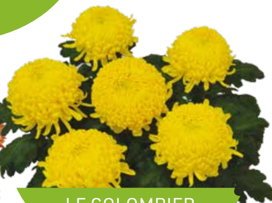
LE COLOMBIER JAUNE®