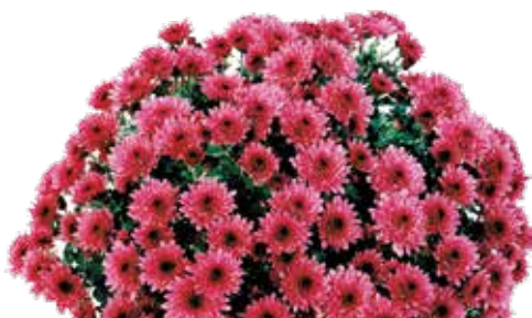
LA VAIGES ©