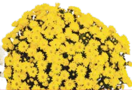
LE GLAINE JAUNE ©