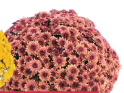
AVALON SALMON ©