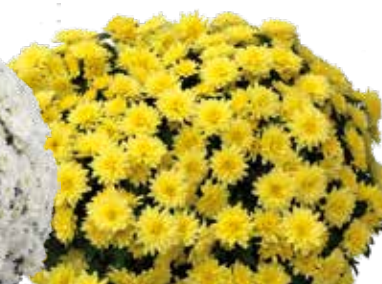
VOILACTÉE JAUNE ©