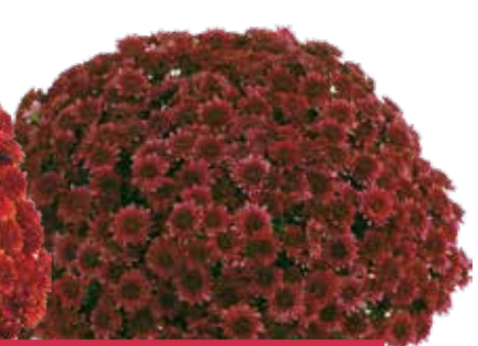
AVALON PURPLE ©