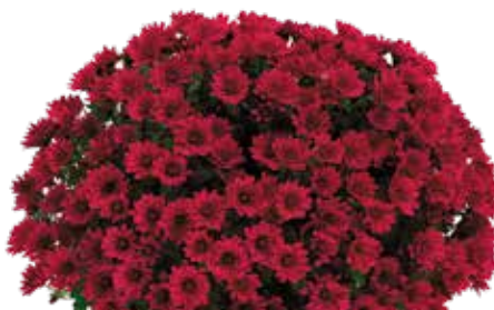
FRANCOISE VIOLET ©