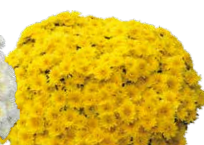
ELEPHANTINE JAUNE ©