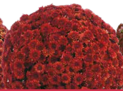
AVALON RED ©