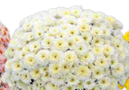
ELEPHANTINE BLANC ©