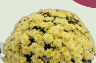
BRANFOUNTAIN LEMON ©