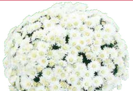
VENT DES ALPES BLANC®