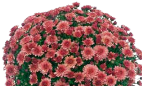
SELFIE SALMON ©