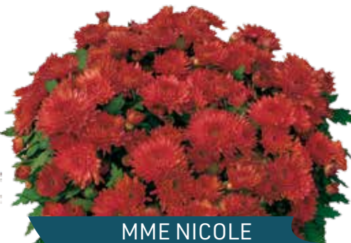
MME NICOLE FALCE ROUGE ®