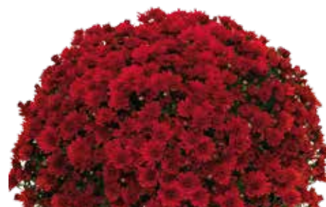
MONIQUE ROUGE ©