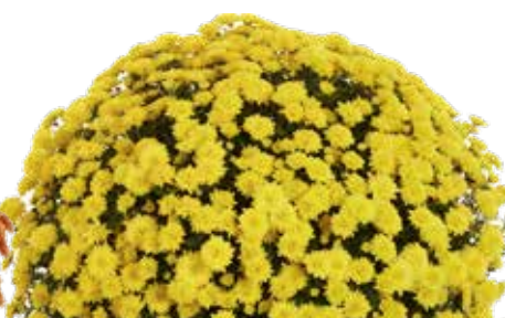
AMÉLIE YELLOW ©