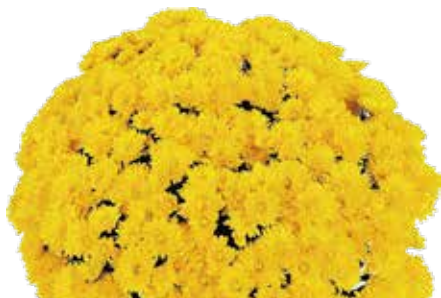
LA BOIRE ©