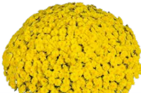
ROSANNA YELLOW IMPROVED ©