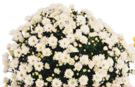
LE GLAINE ©