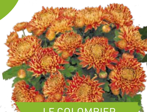
LE COLOMBIER ROUGE®