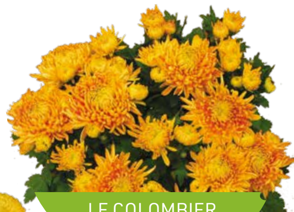
LE COLOMBIER DORÉ®