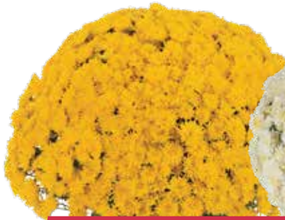
AVALON GOLDEN ©