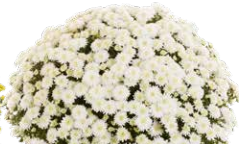
AMÉLIE WHITE ©