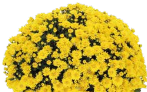
EGLANTINE JAUNE ©