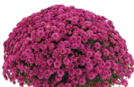
ROSANNA DARK PINK ©