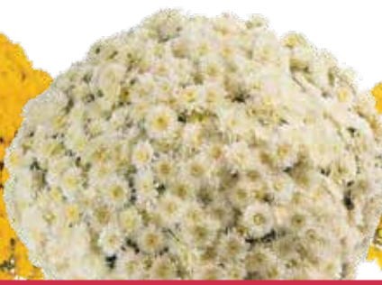
AVALON CREAM ©