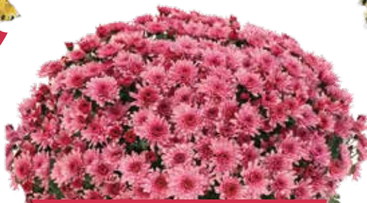
SELFIE PINK ©