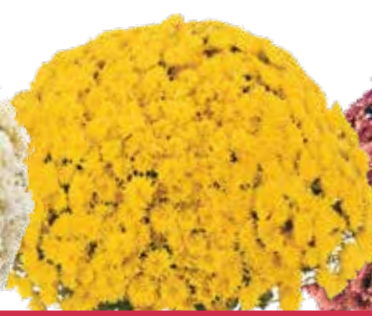
AVALON YELLOW ©