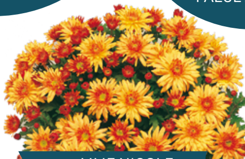
MME NICOLE FALCE CUIVRE ®