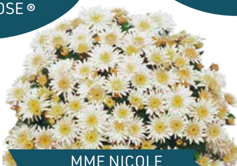
MME NICOLE FALCE BLANC ®