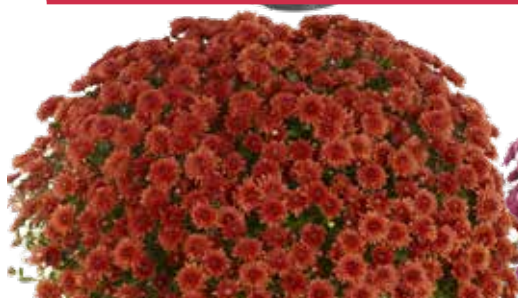
AMÉLIE RED ©