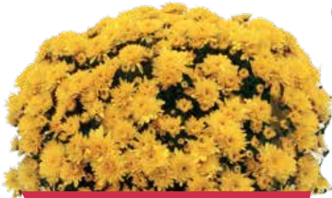
SELFIE YELLOW ©