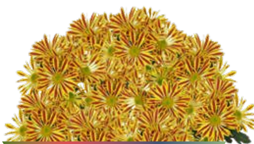
CHARLESTON FIRE ©