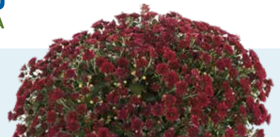
SKYFALL RED IMPROVED®