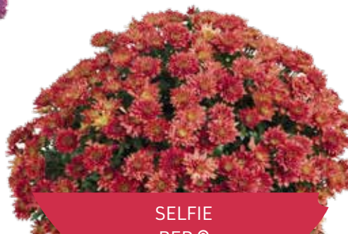
SELFIE RED ©