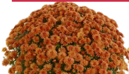
AMÉLIE ORANGE ©