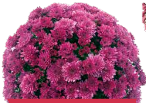
SELFIE PURPLE ©