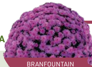
BRANFOUNTAIN PURPLE ©