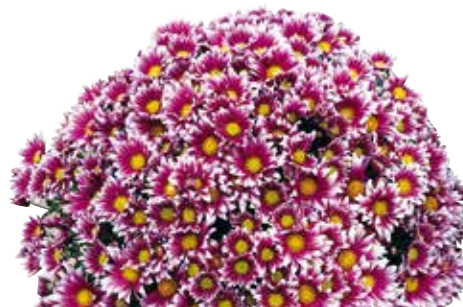
FANFAN BICOLOR ©