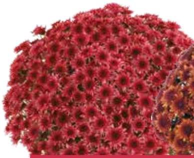
AVALON PINK ©