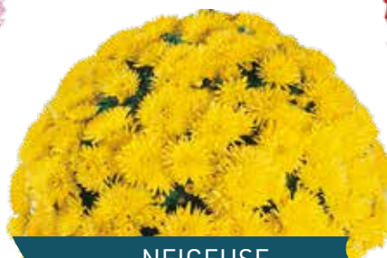
NEIGEUSE JAUNE ®